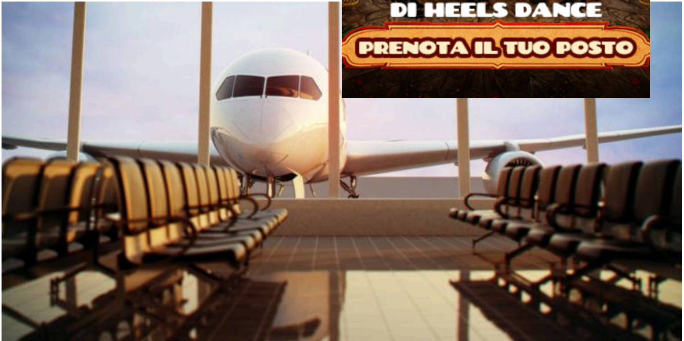
Airplane, view from airport terminal.